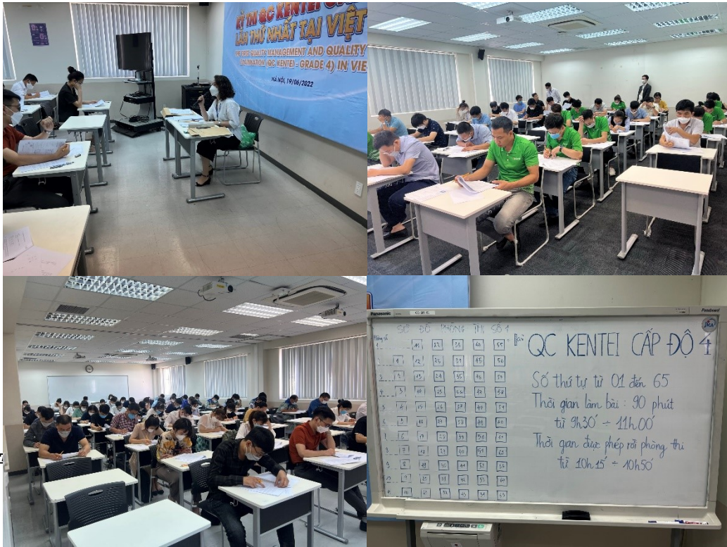
パイロットテスト当日の会場の様子